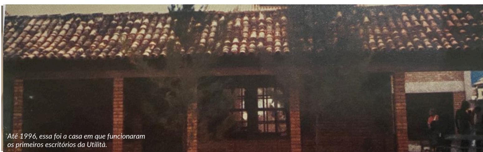
Até 1996, essa foi a casa em que funcionaram os primeiros escritórios da Utilità.