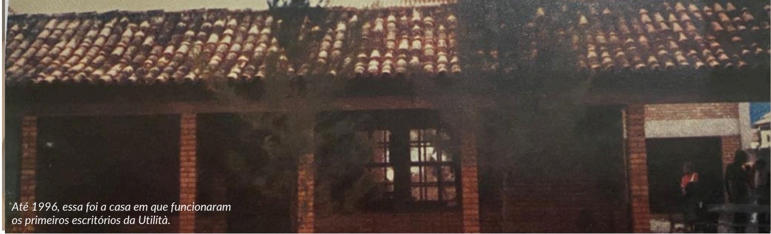
Até 1996, essa foi a casa em que funcionaram os primeiros escritórios da Utilità.